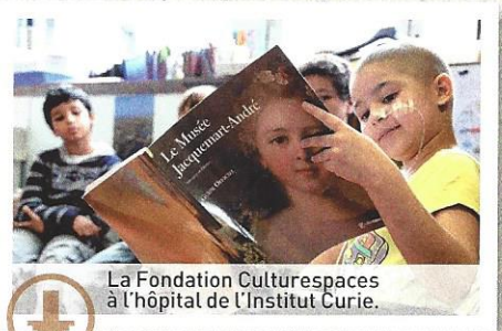
La Fondation Culturespaces à l'hôpital de l'Institut Curie.

En 2013, le Centre de Recherche de l'Institut Curie a une fois encore ouvert ses portes à dix binômes, composés chacun d'un lycéen de 1 re et d'un collégien de 3 e . Depuis six ans, l'institut est en effet partenaire de l'association L'Arbre des connaissances, participant à l'initiative « Apprentis chercheurs », qui permet aux jeunes de s'immerger dans l'activité d'une équipe de recherche les mercredis entre les mois de janvier et mai.