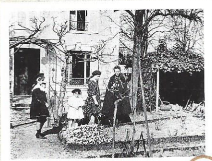
Marie Curie, Irène et Ève, avec une amie, à Sceaux, en 1908.

Deux fois Prix Nobel et sollicitée de toutes parts, Marie Curie concilie sa vie de famille avec la poursuite de ses recherches, et ce même après le décès accidentel de Pierre Curie en 1906. Convaincue de l'importance de l'éducation, qu'elle veut à la fois intellectuelle, pratique et sportive, elle consacre beaucoup de temps à ses filles Irène et Ève.