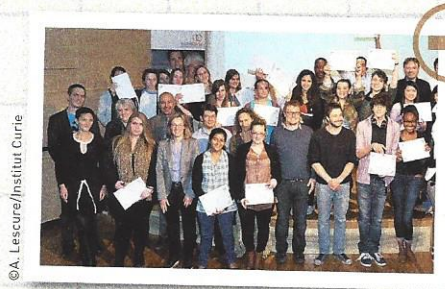
Collégiens et lycéens se sont immergés dans un laboratoire de l'Institut Curie durant cinq mois.

Marie Curie déplorait qu'à l'école « il n'y [ait] pas de travaux pratiques, complétant les études théoriques ». En 1907, elle crée une coopérative d'enseignement pour son aînée Irène et une dizaine d'enfants, notamment ceux des familles Perrin et Langevin, dont les chefs de famille sont deux scientifiques également reconnus. Tous garderont un souvenir ébloui des leçons de physique, de langues, d'histoire, de géographie, de dessin, de mathématiques et de sciences naturelles dispensés à domicile par d'éminents professeurs, parmi lesquels leurs illustres parents.