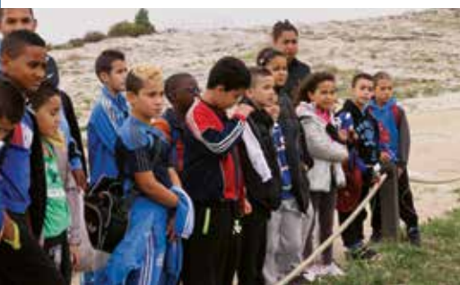
Château des Baux-de-Provence

Dans le cadre de son programme «Patrimoine & Vacances», plusieurs structures d'accueil d'enfants des régions Languedoc-Roussillon et Provence-Alpes-Côte d'Azur participent à des visites guidées du Château des Baux-de-Provence.