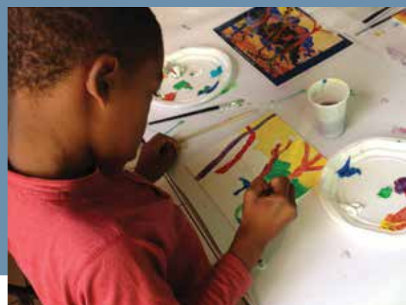
Centre Social Air Bel, Marseille

Le projet «Lumières de Méditerranée» a été mené au sein de plusieurs centres sociaux des quartiers Nord de la cité phocéenne. Un médiateur culturel est intervenu auprès des enfants pour les sensibiliser aux œuvres des grands peintres présentés dans le spectacle «Monet, Renoir...Chagall. Voyages en Méditerranée» aux Carrières de Lumières. Les enfants ont pu chacun créer leur propre tableau à partir d'une sélection de reproductions. Dans un second temps ils ont découvert le spectacle et les monumentales Carrières de Lumières.