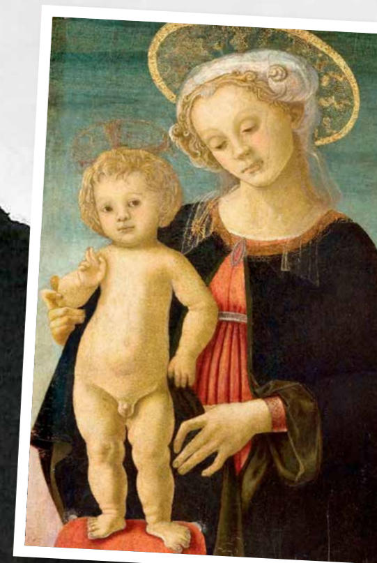
Sandro Botticelli Vierge à l'enfant